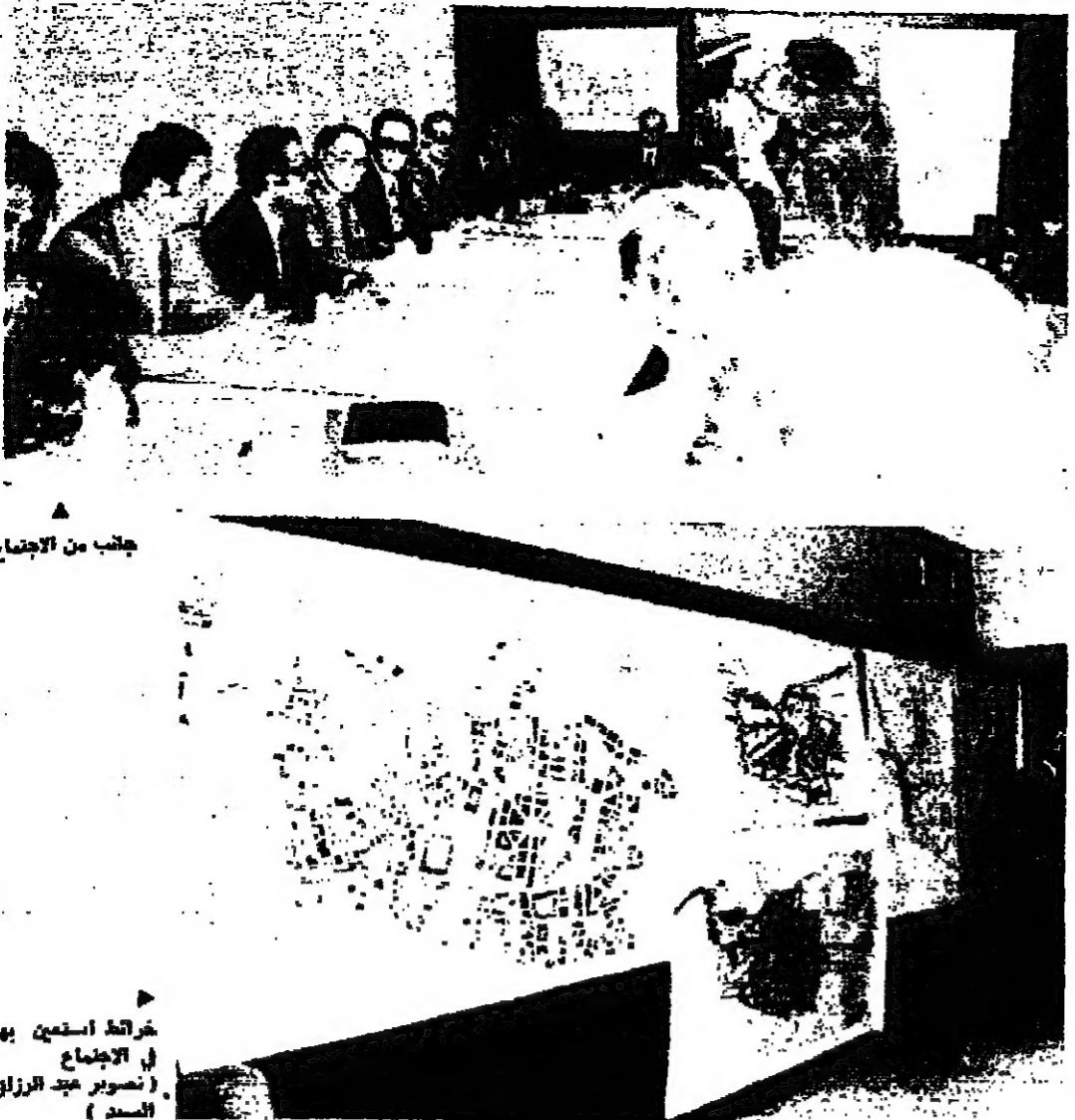
جلسة من الاجتماع